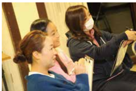
女性の方々も楽しく参加。