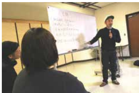
東村山音頭をベースにラップをしよう。

11月4日(土)に、第2回目となるラップ講座ワークショップを東村山市内にて開催しました。悪天候の中お集まりいただき、なんと今回は東村山市長にもご参加いただきました！前回同様ラップの基本、自己紹介ラップの発表のあと、いよいよ歌詞の作成。言葉をのせていく曲は、東村山音頭！東村山の「ここが惜しい！」という所をあげて、今回は「ネガティブ編」として歌詞を作りました。「次は魅力詰まった歌詞で、ネガティブ全部ひっくり返そう！」と決意と確認、そして最後にみんなで歌い盛り上がりました。東村山市の次回作が楽しみです！