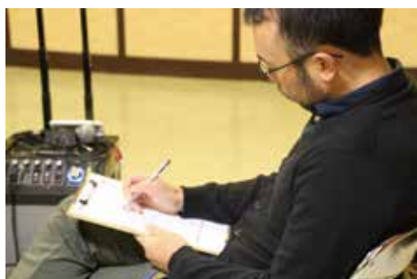
自己紹介ラップに一生懸命。