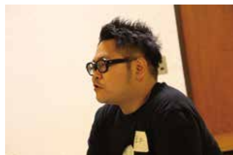
地元愛について真剣に語ってます。