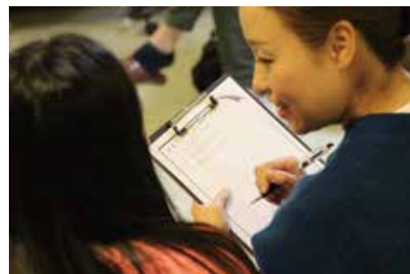
親子で楽しくラップを考えます。