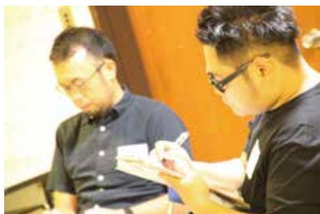
皆さん、とても熱心です。