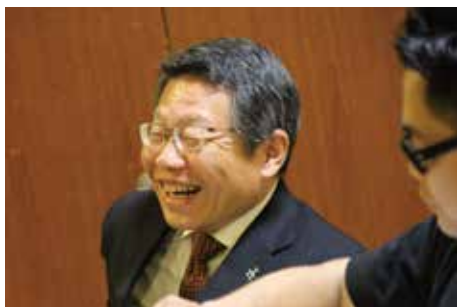
市長も笑顔でご参加。