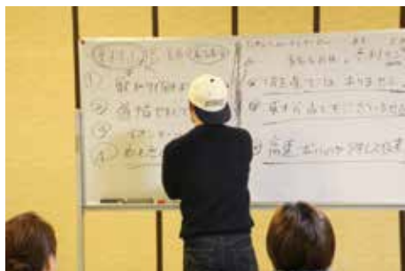
皆さんの話を元に歌詞をまとめます。