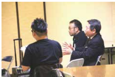
市長も積極的にお話されてます。