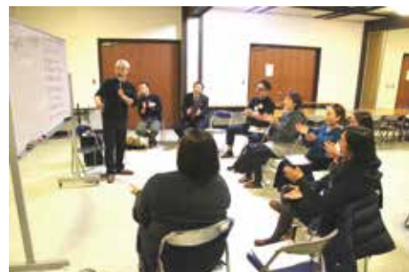
完成したら、参加者全員で一緒にラップ☆