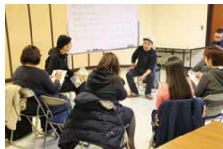
アットホームに意見を出し合います。